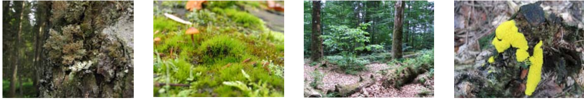
Abb. 2: Eindrücke der Vorexkursion vom 07.07.2006