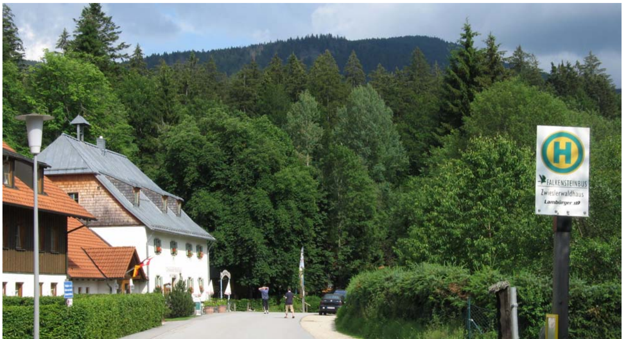
Abb. 1: Blick auf das Gasthaus „Zwieseler Waldhaus“ im Hintergrund der Falkenstein

Die Tagung ist eine Veranstaltung der Zentralstelle für die Floristische Kartierung Bayerns in Zusammenarbeit mit der Deutsche Gesellschaft für Mykologie (DGfM). Kontakt: Universität Regensburg, D-93053 Regensburg, Tel.: 09405/9570999, E-Mail: oliver.duerhammer@biologie.uni-regensburg.de